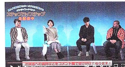
オンラインイベントのようす