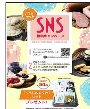
SNSキャンペーン広告