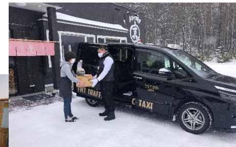
荷物受取・配達の様子